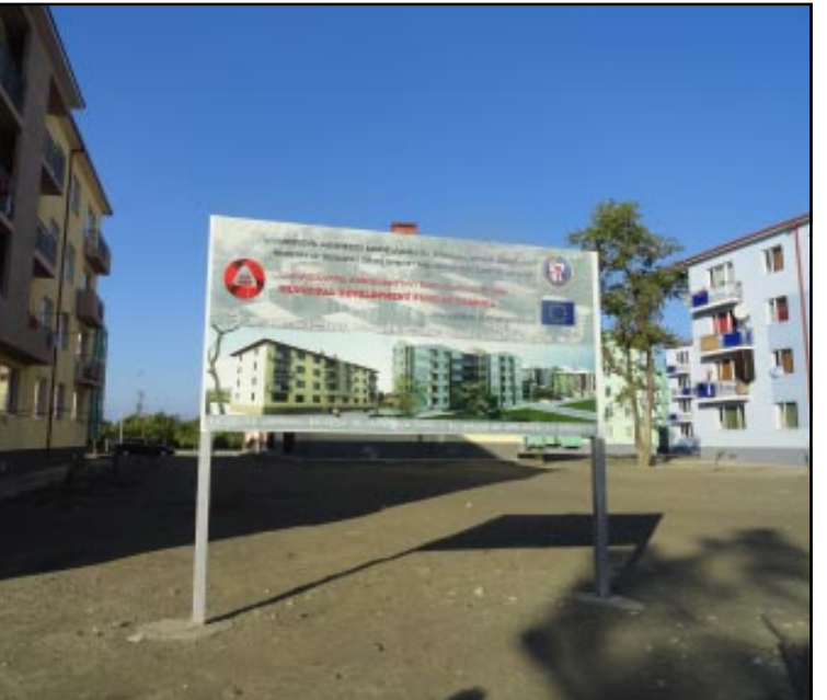
ქ. ფოთში იძულებით გადაადგილებულ პირთა საცხოვრებელი უბანი - ასე წერია აბრაზე, რომლითაც ხელისუფლება დევენილებს დანარჩენი საზოგადოებისგან მიჯნავს

რაც შეეხება ბინების გადაანაწილების კრიტერიუმების დაცვას, დევენილებში აზრთა სხვადასხვაობაა: ის, ვინც კამყოფილია, მიიჩნევს, რომ სამართლიანად განაწილდა, უკმაყოფილონი - პირიქით. არის ისეთი შემთხვევებიც, როცა გაურკვეველია, რა პრინციპით