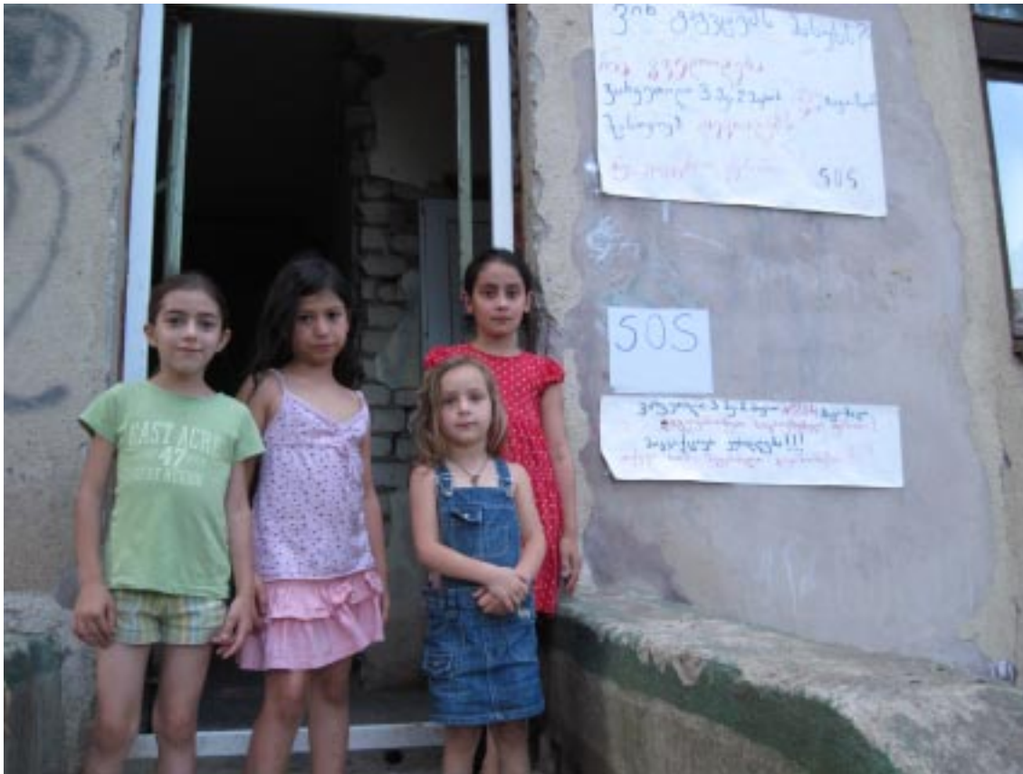
განსახლების სამინისტრომ დღეს თბილისში მდებარე 204-ე ბაგა-ბაღის შენობაში 70-მდე ოჯახის გამოსახლებას აპირებს. ვარკეთილი-3 მე-2 მიკრო-რაიონში მდებარე ყოფილი 204-ე ბაგა-ბაღის შენობაში აფხაზეთიდან დასახლებულ ოჯახებს.

ამსაკითხთან დაკავშირებით ოკუპირებული ტერიტორიებიდან იძულებით გადაადგილებულ პირთა, ლტოლვილთა და