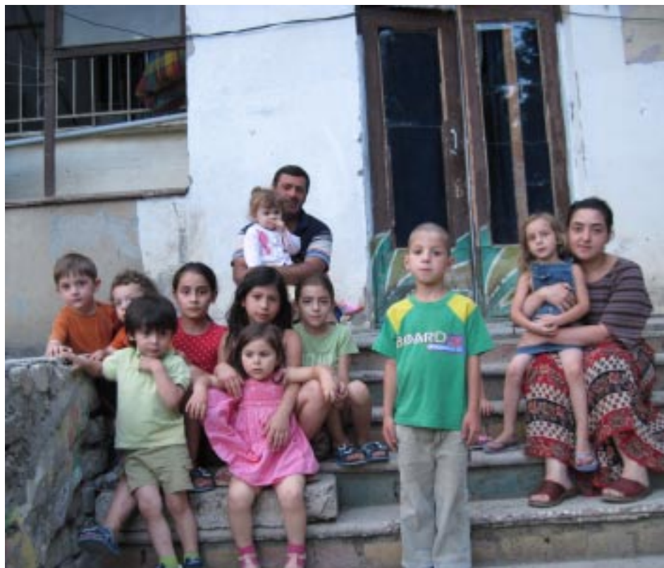
204-ე ბაგა-ბაღში აფხაზეთიდან და სამხრეთ ოსეთიდან დევნილი 18 ოჯახი ცხოვრობს. აქ 32 ბავშვი (უმეტესად, მცირეწლოვანი) ცხოვრობს. სად უპირებენ მათ ოჯახებს გასახლებას? ეს კითხვა პატარების სმენასაც სწვდება.

- თუკი შემოთავაზებული ვარიანტები არ გაკმაყოფილებთ, კანონის მიხედვით, გაქვთ უფლება, ალტერნატიული საცხოვრებელი